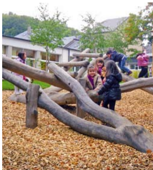
Die Vorschule in Nieder Korn hat seit Juli ein neuer Schulhof. » 4

Ein kinderfreundlicher und naturnaher Schulhof