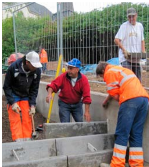
Une nouvelle aire de jeux créative autour du thème de la ferme et des animaux » 3