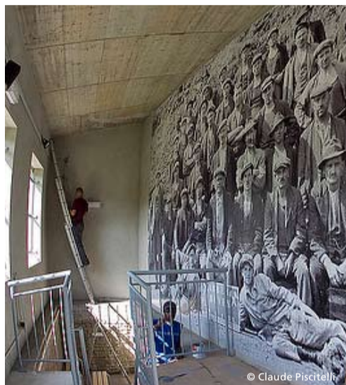
Bref aperçu des activités des 6 services du CIGL Differdange » 2